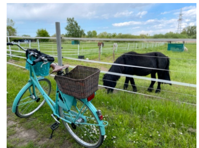
Zwischen Landwehr und Eixe gibt es weitläufige Weideflächen.