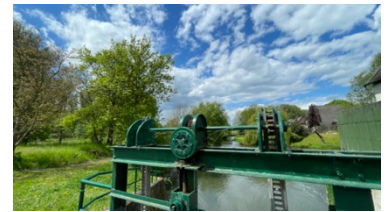
Das alte Wehr bei der Mühle in Eixe steuert auch heute noch die Höhe des Wasserstandes.

Abdruck honorarfrei – die Verwendung der Fotos ist frei für journalistische Zwecke zur Berichterstattung im Zusammenhang mit dem Inhalt der Pressemitteilung bei Nennung der Quelle.